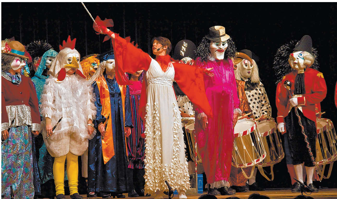
Zauberhaft: die «Rotstab-Fee» als Muse für die Akteure vor und hinter dem Vorhang.