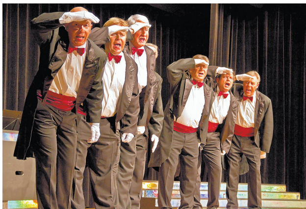
Die Städtli Singers in neuer Besetzung.