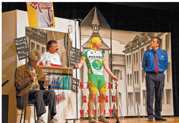
Doping statt Kebab: Die Tour de Suisse kommt nach Liestal.